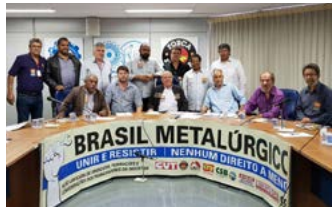
Dirigentes sindicais debateram ações em reunião

"Não há possibilidades de se assegurar serviços públicos essenciais a que a população brasileira tem direito sem garantir que investimentos no setor aconteçam. (...) Juntas, essas mudanças fatalmente vão provocar o aumento da desigualdade social no Brasil, tão prejudicial para qualquer sociedade. Este é um dos principais reflexos que será provocado com a retirada de direitos embutidos tanto na EC 95/16, quanto nas reformas trabalhista e da Previdência. Some-se a isso a entrega acelerada ao mercado especulativo internacional de setores essenciais e estratégicos", ressaltou o Fórum.