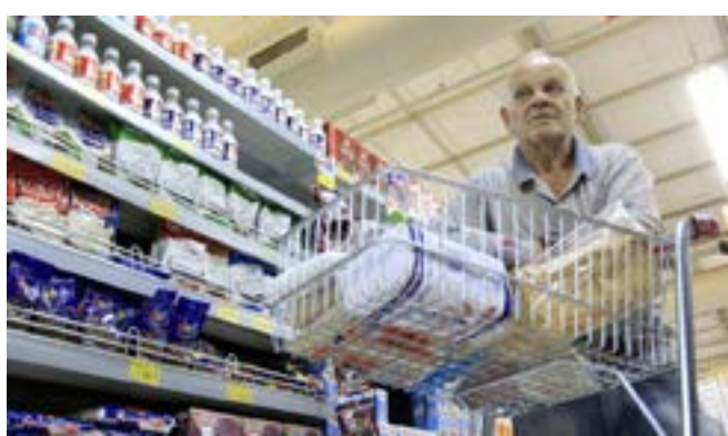
Com salário mínimo menos, poder de compra cai

Com isso, já são R$ 14 tirados do bolso do trabalhador e de pensionistas do INSS por mês, enquanto a qualidade dos serviços públicos vem se deteriorando cada vez mais - especialmente após a emenda do corte de gastos, que prevê o congelamento nos investimentos públicos pelos próximos 20 anos, ou o crescente ataque aos funcionários públicos (ver matéria nesta página). Segundo o informe do ministro do Planejam-