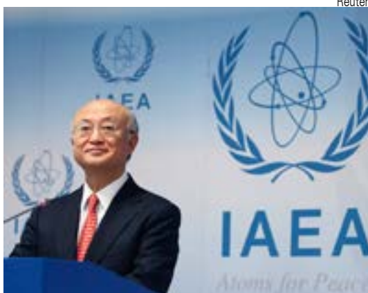
Yukiya Amano foi a Teerã como diretor da Agência Internacional de Energia Atômica. Chefe da AIEA reafirma: Irã cumpre todo o Acordo Nuclear

Apesar do debate, de pequenas mudanças nas leis e da organização de greves e protestos, nada muda: a diferença salarial entre homens e mulheres continua 19% em média de acordo com o Observatório das desigualdades na França. Entre os que têm cargos executivos a diferença é de 26,3% e entre os funcionários 9,3%. Em média, quando um gerente recebe um salário líquido mensal de 4.380 euros, uma mulher executiva receberá apenas 3.469 euros. ROSANITA CAMPOS