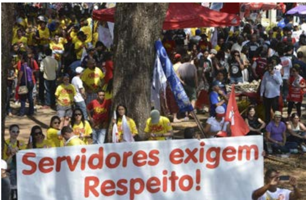
Servidores prometem parar o país no dia 10, Dia Nacional de Mobilização