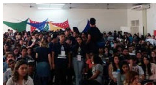
Congresso das entidades reuniu mais de 600 estudantes