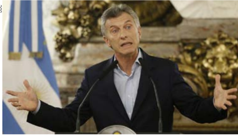
Para Macri, leis que garantem direitos trabalhistas geram “excesso de litígio”