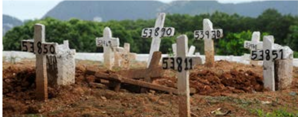
Número de mortes no Brasil é considerado endêmico, segundo critérios da ONU

O DCE Livre da USP afirmou que "o resultado das eleições não reflete os anseios da comunidade acadêmica".